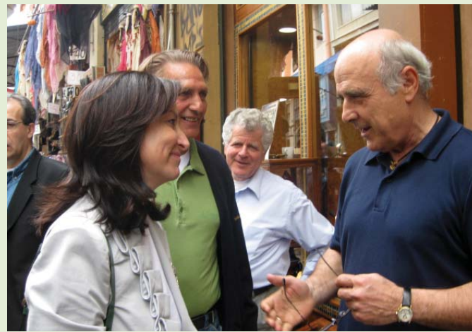
Σύσκεψη για τα προβλήματα της Α' Αθήνας