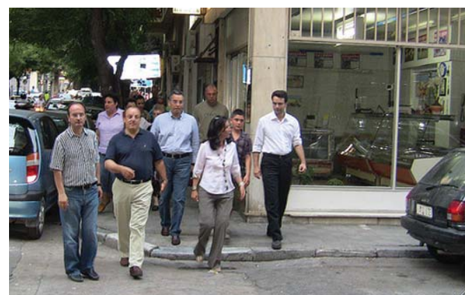
Η Άννα Διαμαντοπούλου στον Άγιο Παντελεήμονα

Συνέχεια στην σελ. 4 «Από το Βήμα της Βουλής»